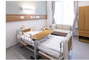
▲個室(洗面台・シャワー・トイレ付)