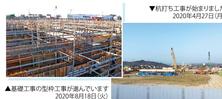
▲基礎工事の型枠工事が進んでいます 2020年8月18日(火)

今回は写真と共に、現在の姿を公開いたしております。今後もホームページなどを通じて、工事の進行状況をお届けいたします。